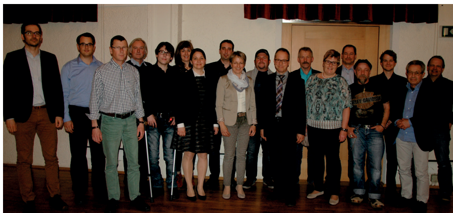
Die neue Gemeindevertretung 2015-2020 (siehe Seite 4)